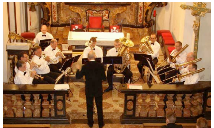
En pleine action dans l'église Sant'Abbondio de Gentilino